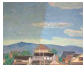
修復途中の状況 左側洗浄前、右側洗浄後

書道作品を中心に修復が必要な作品はまだ残っております。今後ともご支援のほどをお願いします。