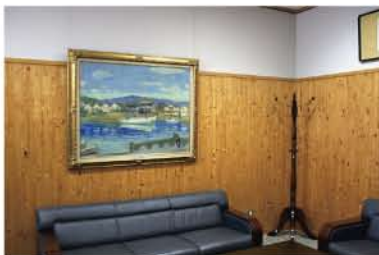
展示場所 / 校長室