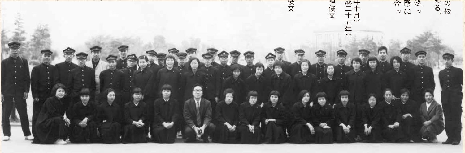
▲岡山朝日高校最初の修学旅行/広島平和記念公園(昭和37年卒)

行の日は関係ないが、進学校としての伝統はいまだに受け継がれているようである。以上わが母校の修学旅行の変遷を巡ったわけであるが、昔の仲間が集まった際にそれぞれの修学旅行の思い出を語り合っではいかがであろう。